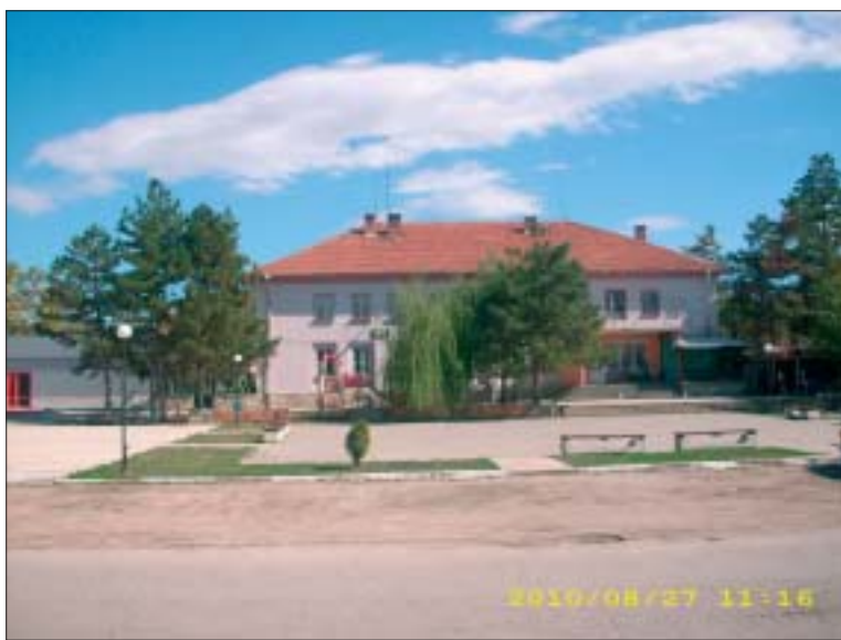
Селското читалище „Нагежда“