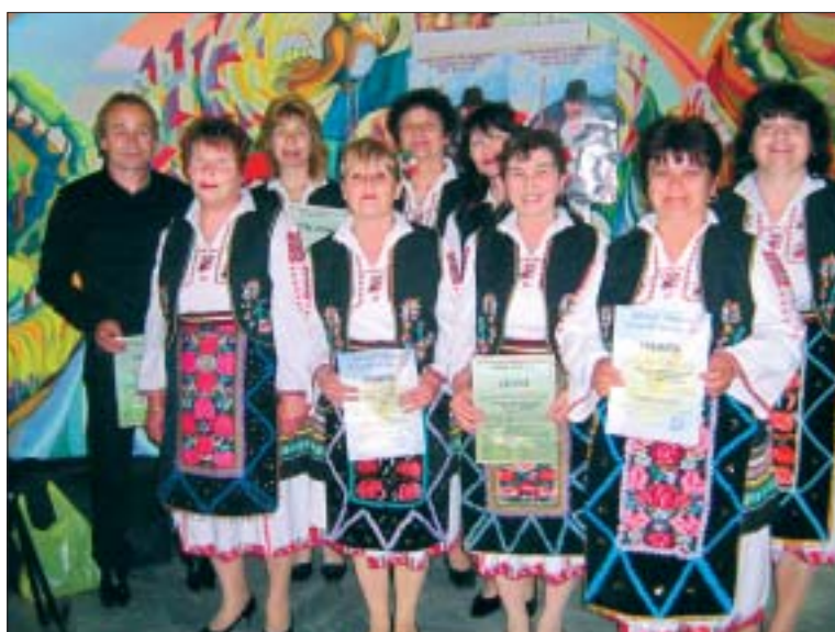
Женска певческа група за народни песни при НЧ „Нагежда“

В селото има една частна Трудово-производителна кооперация, която обработва земята на стопаните под аренда. Отглеждат се ече-