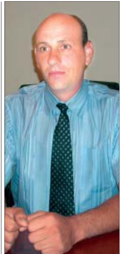
Кметът Борислав Боянов