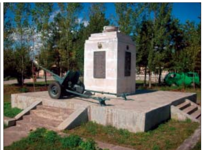
Паметникът на загиналите във войните от селото

По случай честването на 100-годишнината на читалището е сформирана женска певческа група за народни песни. Групата участва в събори и фестивали в цялата страна. Има участия в Старопланински събор „Балкан фолк“ – гр. Велико Търново, в „Искри от миналото“ – гр. Априлци, лауреати са на Черноморски събор „Евро фолк“ – Царево 2006 г., Лозенец 2007 г. и Приморско 2008 г. Лауреати са и на Първи национален шампионат по народни изкуства „Евро фолк“ – 2010 г.